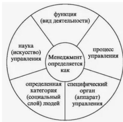
Рисунок 1.1 – Проявление сущности менеджмента

Управление – это деятельность по руководству людьми и определенными процессами, предполагающая подчинение одного субъекта другому и направленная на упорядочение процессов, протекающих в природе и обществе (рис. 1.1).