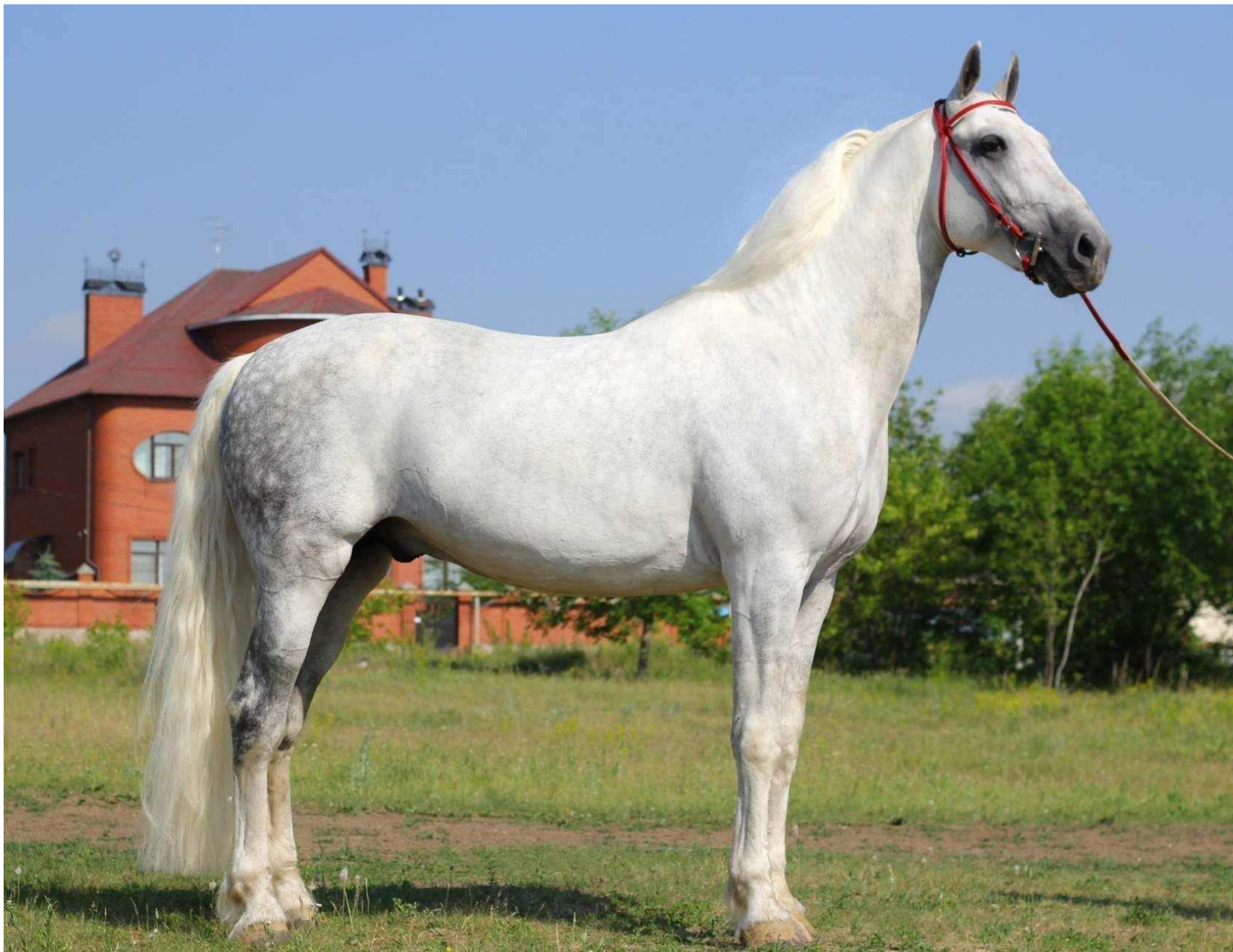
Орловская рысистая порода