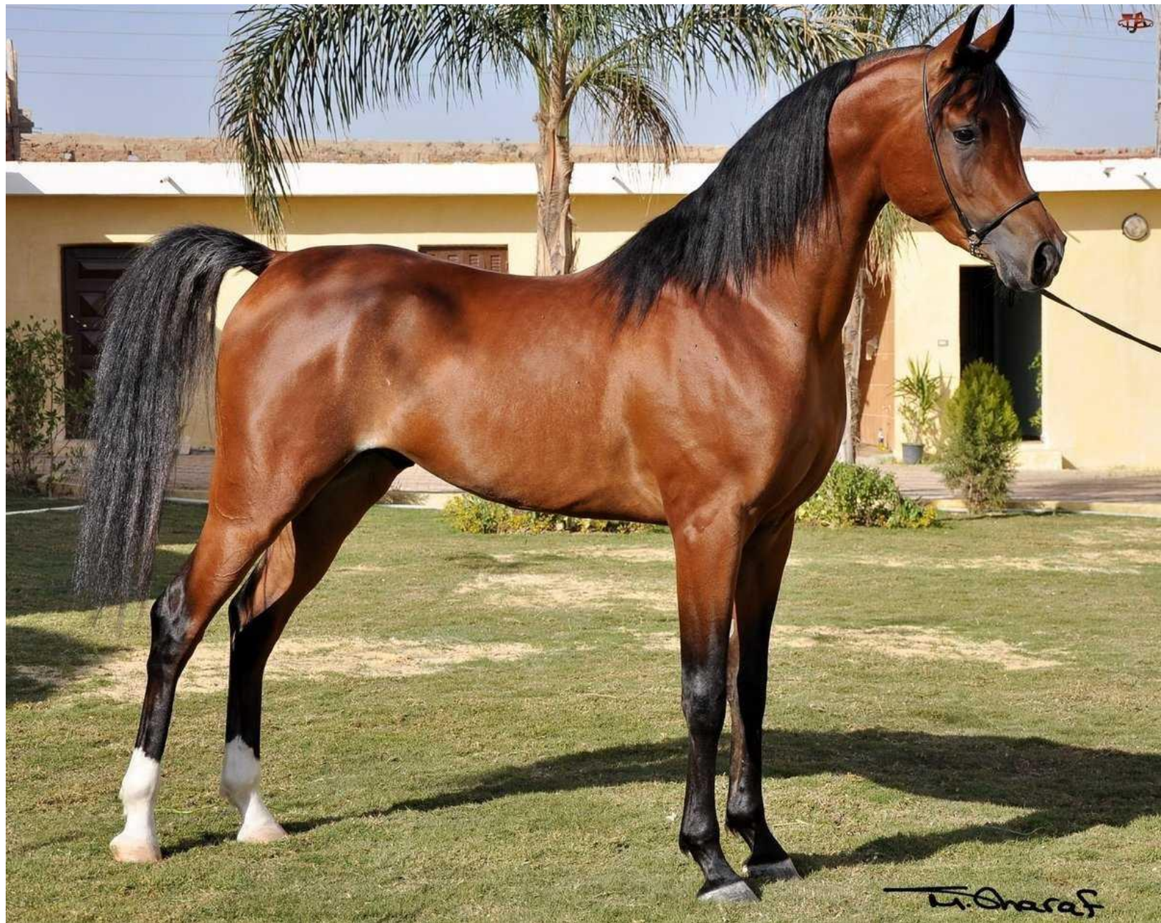
Арабская чистокровная порода