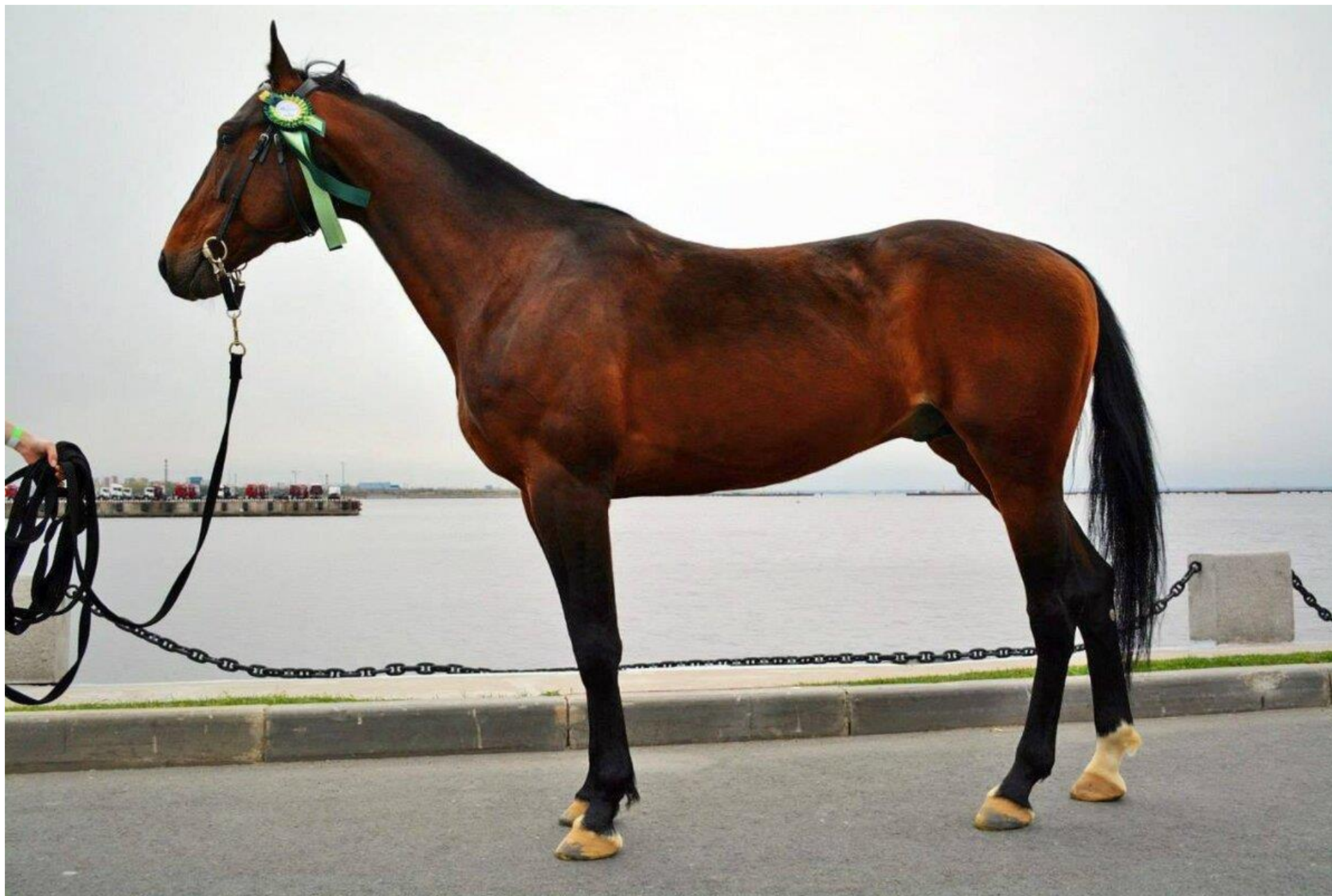
Русская рысистая порода