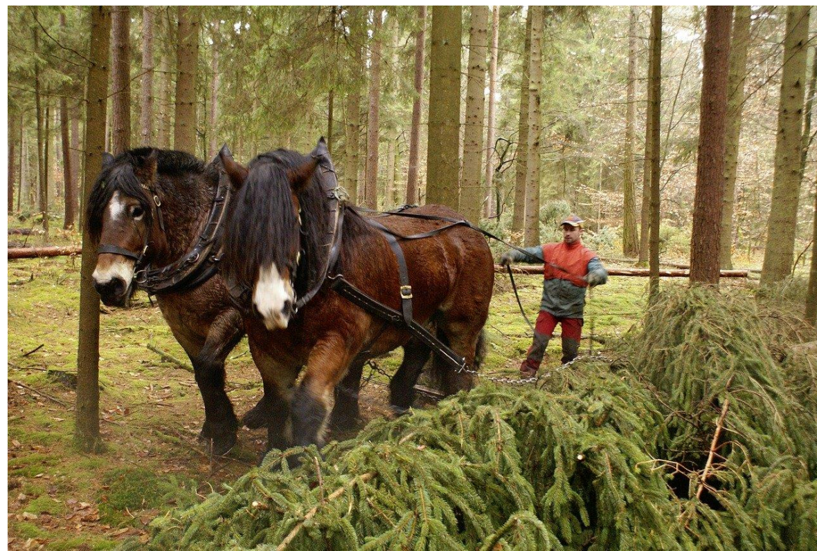
Проведение различных работ в лесу (вырубка, заготовка)