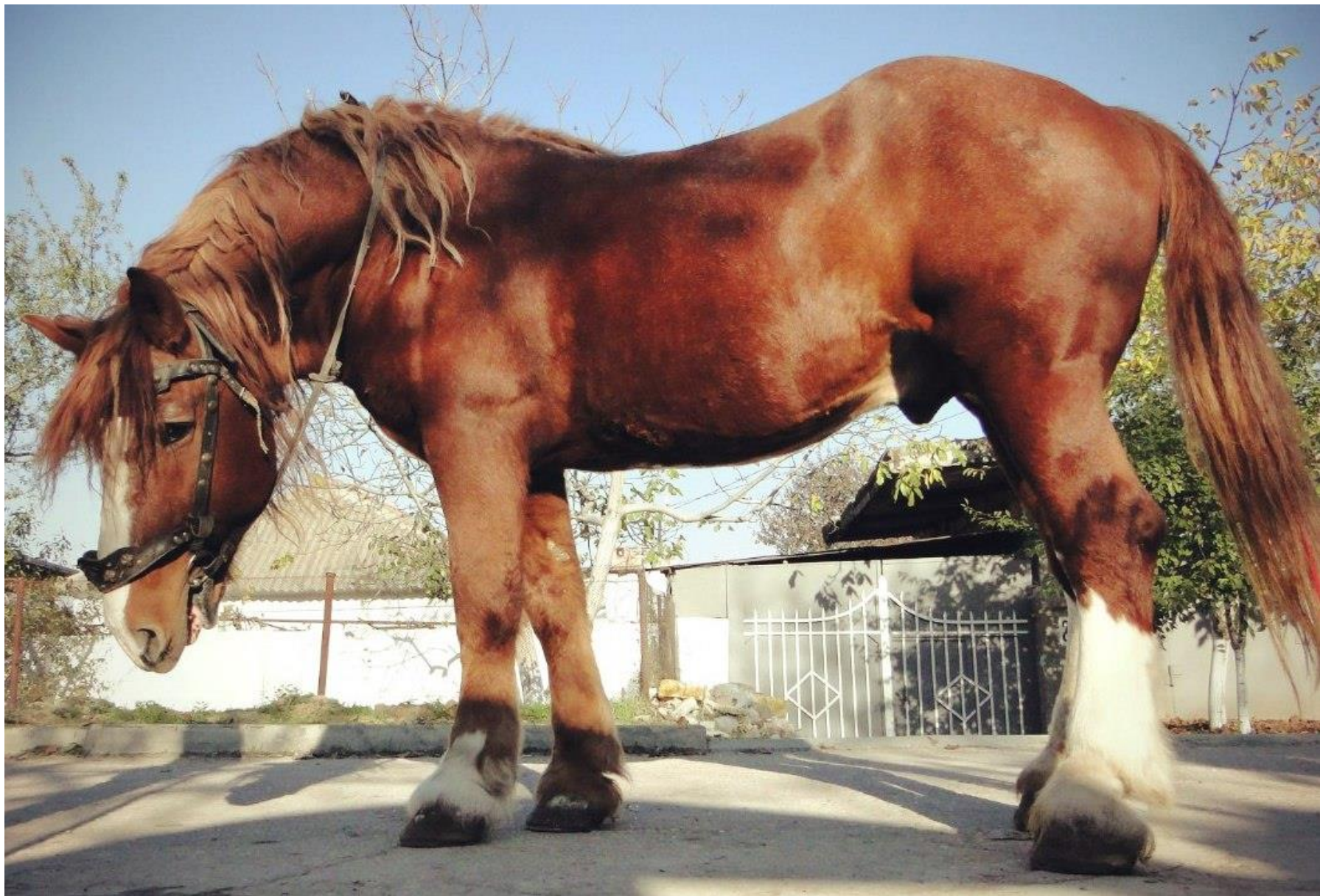
Русская тяжеловозная порода