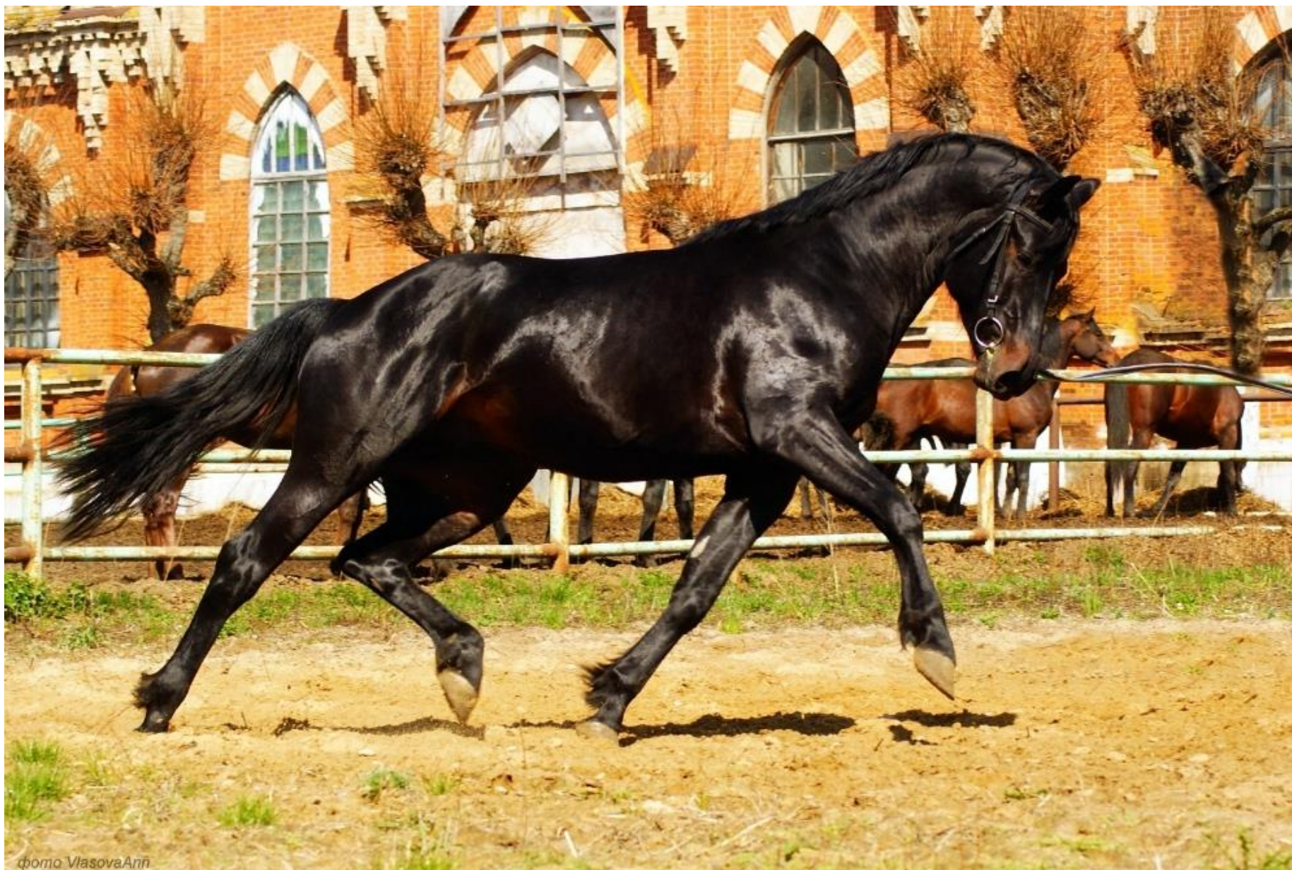
Русская верховая порода