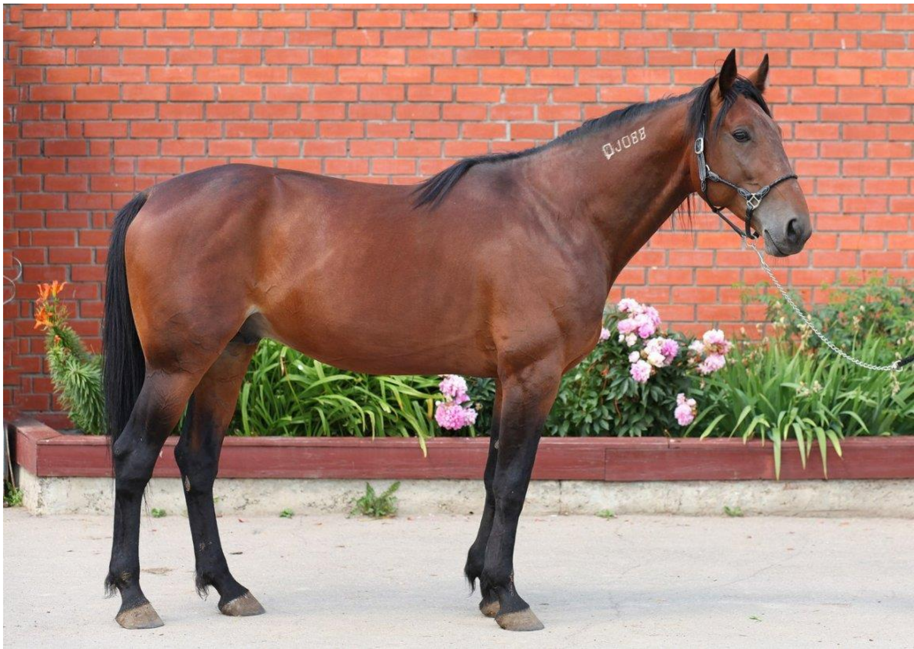
Американская стандартbredная порода