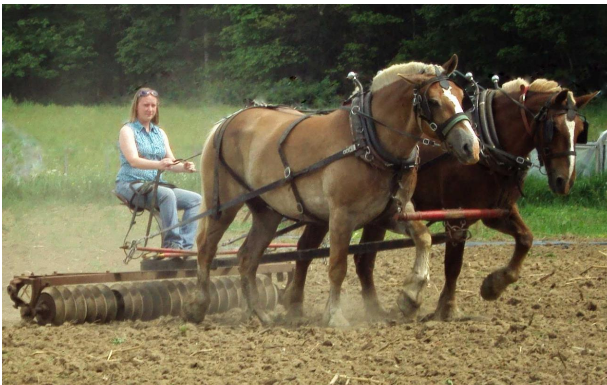
Проведение различных полевых работ

Основная особенность отрасли коневодства является главный вид ее продуктивности - различные виды механической работы, полезной для человека.