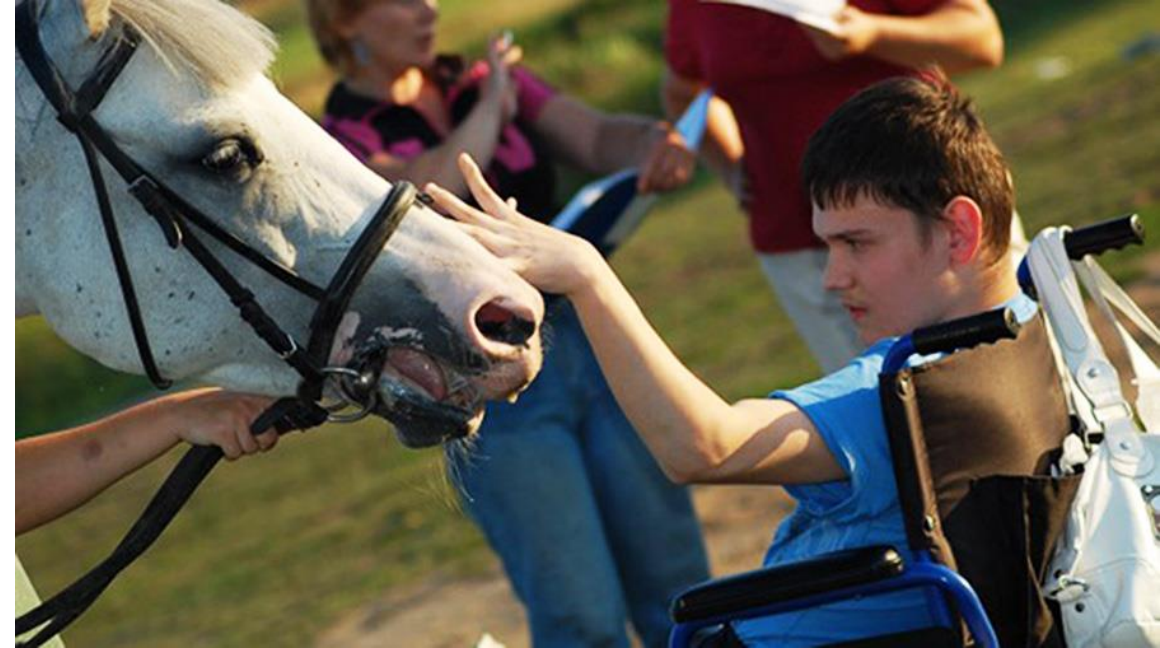
Иппотерапия (лечебная езда)