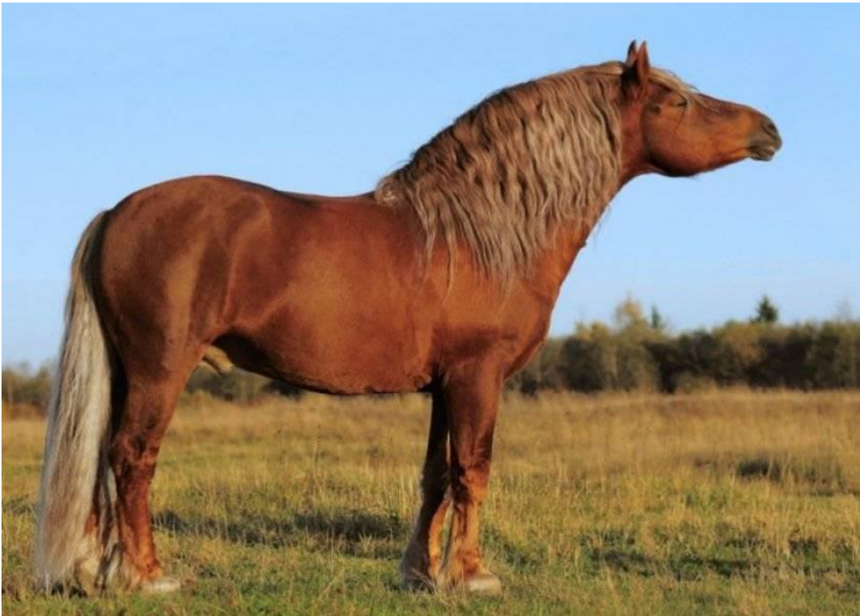
Советская тяжеловозная порода