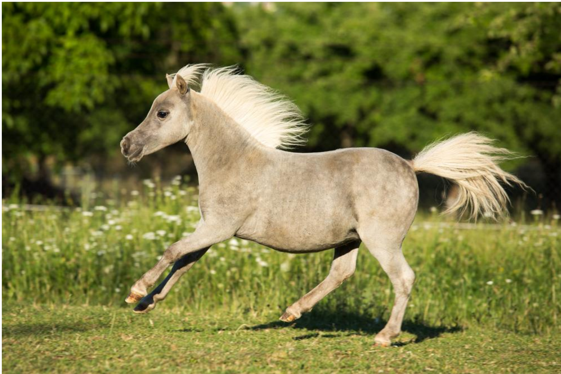
Американская миниатюрная лошадь