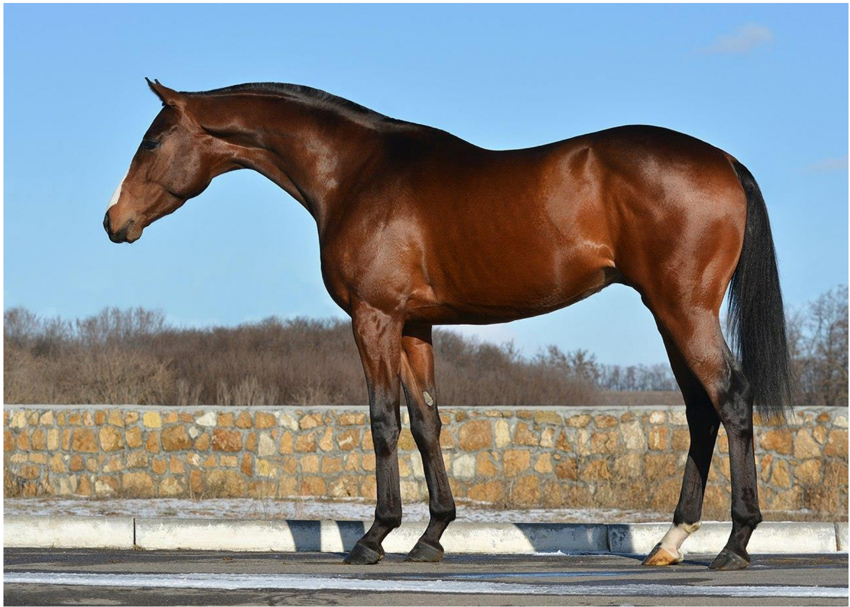
Чистокровная верховая порода