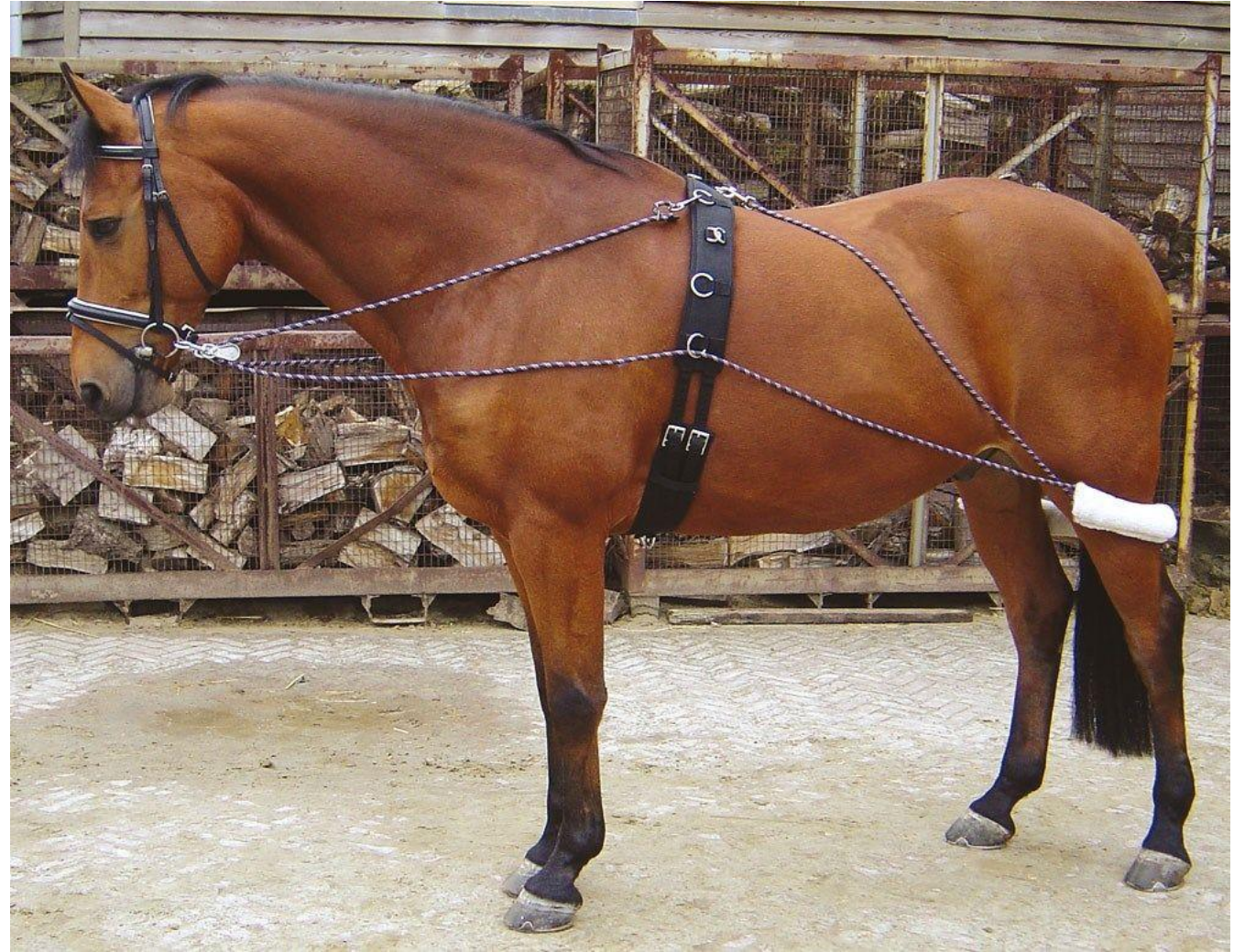
Легкий трок со слабо подтянутой подпругой и подхвостником