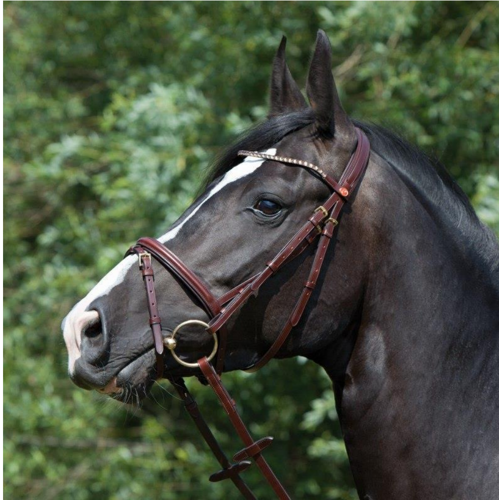
Уздечка с простыми удилами